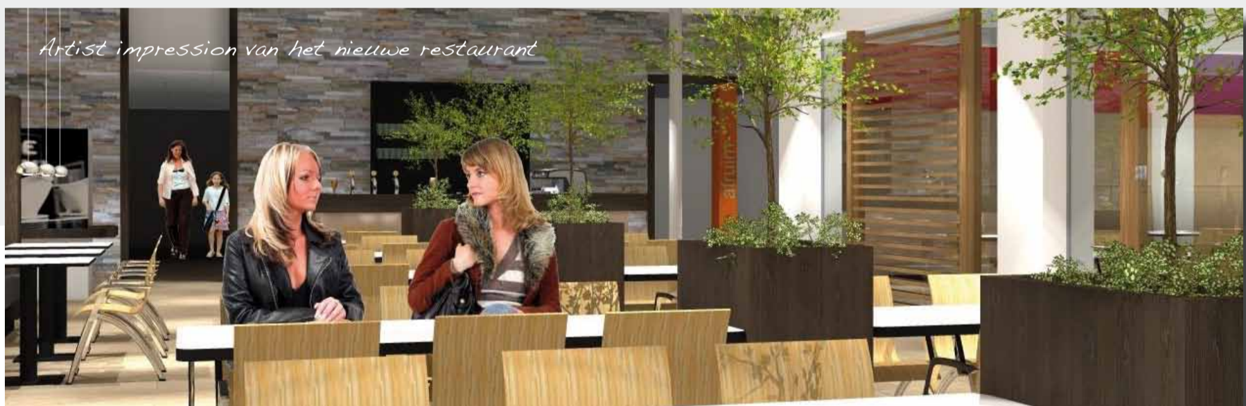
Artist impression van het nieuwe restaurant