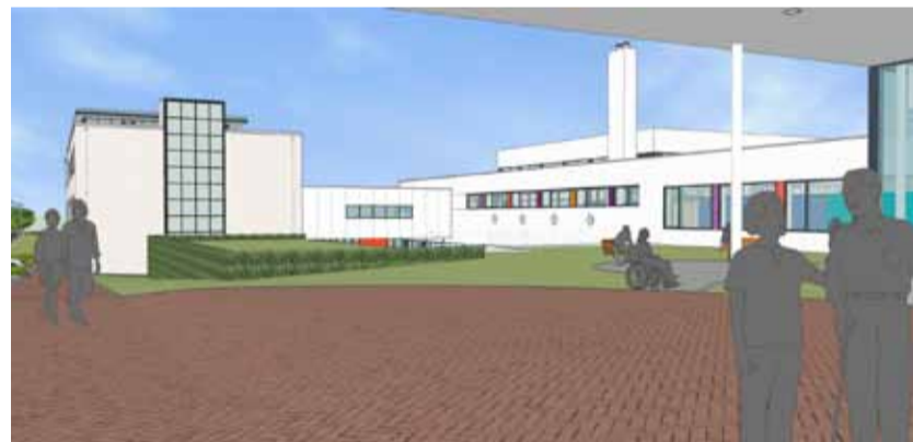
Een impressie vanuit de hoofdingang richting bestuursgebouw

In het hoofdgebouw zijn de nieuwe entree met het patiëntenservicebureau en de Oase klaar. Met de ingebruikname van het patiëntenservicebureau heeft Adelante meteen een nieuwe service ingevoerd: de hele dag staan hier gastvrouwen klaar om cliënten te ontvangen en, als dat gewenst is, naar hun afspraak te brengen. Ook de nieuwe Oase is in gebruik. Het restaurant bestaat uit meerdere, door glazen wanden van elkaar gescheiden ruimtes waardoor het mogelijk is om in een besloten kring koffie te drinken, samen te eten of zelfs een receptie te organiseren. Van deze gelegenheden wordt volop gebruik gemaakt. Maar het is even goed mogelijk om er in alle rust even bij te komen van de therapie. Door het vele glas