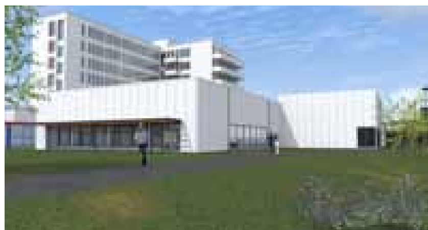
Een impressie van het nieuwe sportcomplex

Op de locatie van de vroegere Oase vordert de bouw van de nieuwe sporthal. Nog voor de zomervakantie zal het zwembad gevuld worden.