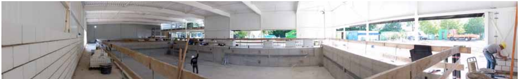
Het sportcentrum wordt nu verder afgewerkt - september 2015

* Zoutelektrolyse zorgt ervoor dat er geen irritaties aan bijvoorbeeld de huid of ogen ontstaan.