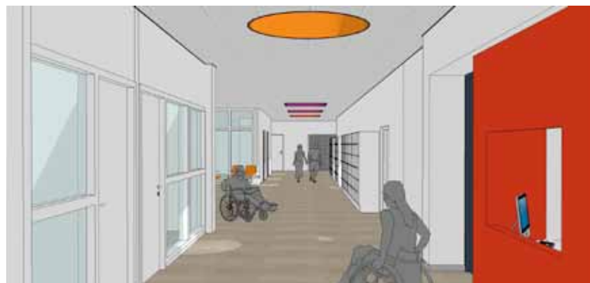
Impressies van het nieuwe behandelplein.

(sport medisch centrum en een deel van het beweeglab) komt op zijn definitieve plek terecht.